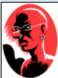
Fufu Frauenwahl (Illustrator – Reiter der schwarzen Sonne u.a.)