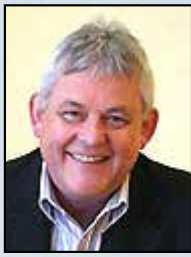
Joe Dever Autor der berühmten Spiel- buchreihe EINSAMER WOLF